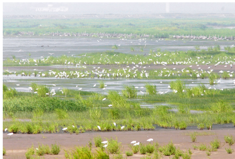
东滩湿地水鸟成群

效,同时也为提高上海的人均公共绿地、森林覆盖率提供了一个相当厚实的基础。在浦东环城绿带的建设过程中,以“建设不断完善、管理不断创新、服务不断优化、使环城绿带生态功能、社会服务功能不断得以提升”为目标,按“属地化管理、企业化经营、综合化管理”的原则,12家属地化养护公司承担起绿化养护任务。近年来,浦东新区环城绿带在防火、防汛、平安建设、资产管理、业务培训等方面积极探索,巩固和提升了环城绿带的综合功能。