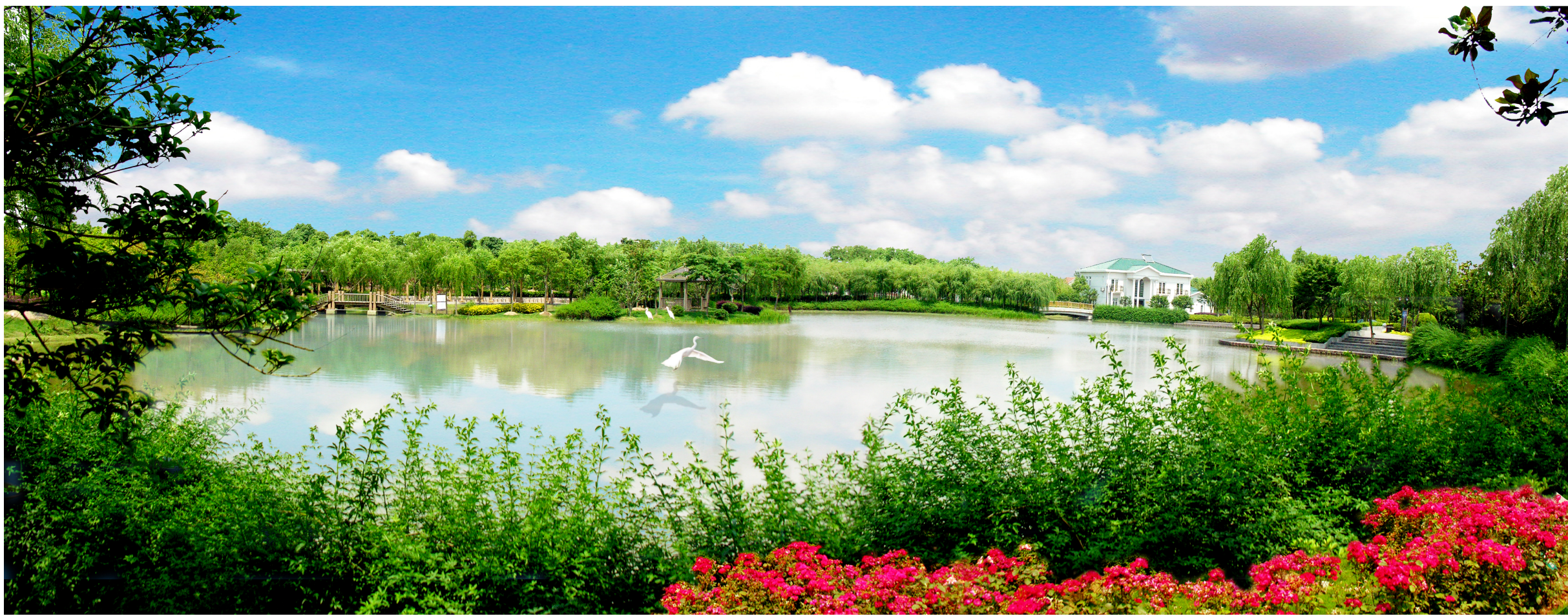
如诗如画的浦东环城绿带