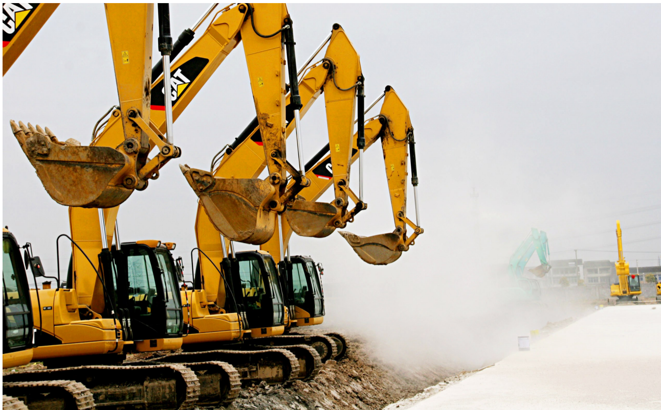
2011年4月8日,中国内地首个迪士尼乐园项目在上海浦东开工建设。 □本报记者 徐网林/摄