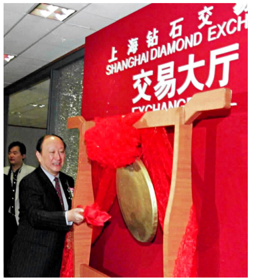
2000年10月27日,全国第一家钻石交易所——上海钻石交易所在金茂大厦宣告成立。