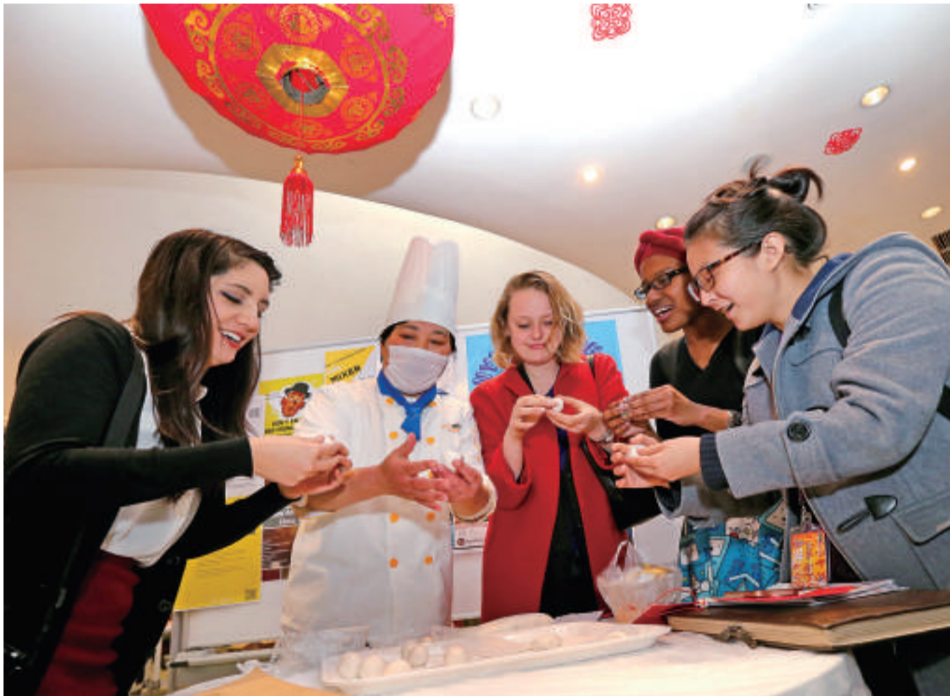
来自美国、荷兰的学生在中国厨师的指点下开心地包汤圆。

这样的时间安排无疑受到了高三师生的欢迎。董智武和沈铭峰一致认为,今年的高校自主招生由教育部统一牵头有序开展,时间安排上更为合理,将对高三正常教学计划的影响降到了最低,为师生减负。