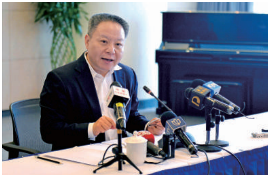
沈晓明正在接受媒体集中采访。

德勤调查,改革开放以来进入我国的外商投资成功率大概是三分之一,浦东是三分之二,成功率是全国平均水平的两倍。接下来,浦东要培育和吸引民营创新企业和民营龙头企业集聚,靠的一定不是设计新的政策,而是要为他们创造更好的发展环境和发展机会。