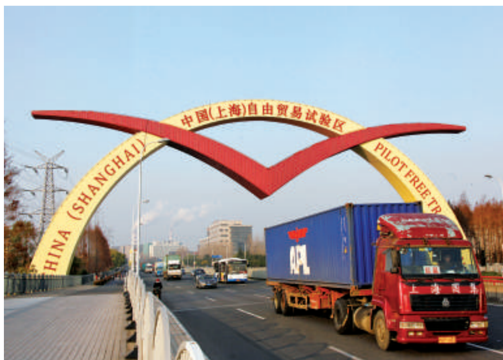
自贸区扩区后,浦东将形成三个层面的自贸区。