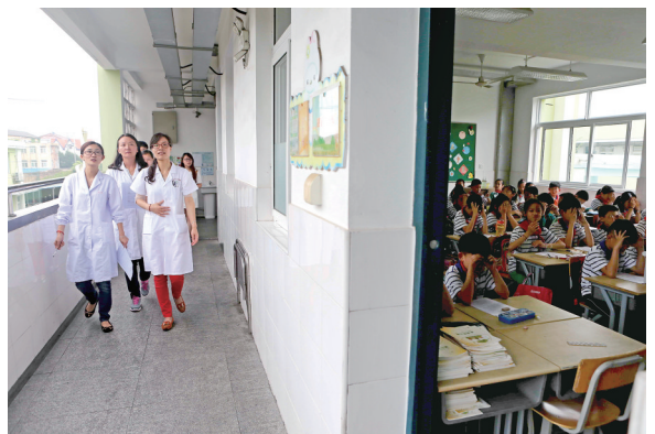
②医生前往“疫情”学校进行调查。