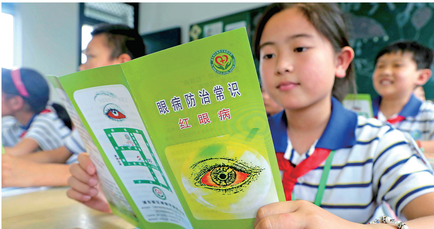
⑧同学们正在认真阅读由医生发放的红眼病防治宣传册。

按照红眼病爆发规律，今年浦东新区发生红眼病爆发流行可能性较大。6月15日，新区眼病牙病防治所举行了首场红眼病应急防控演习，检验本区各相关单位对红眼病疫情的应急指挥和组织协调能力，以便及时发现和规范处置疫情。