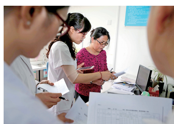
③医生从校医务室了解“患病”学生情况并做详细记录。