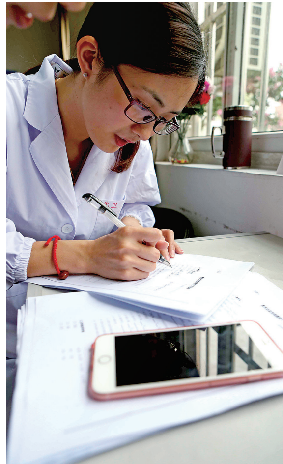
④医生打电话给“病患”学生家长了解病症。