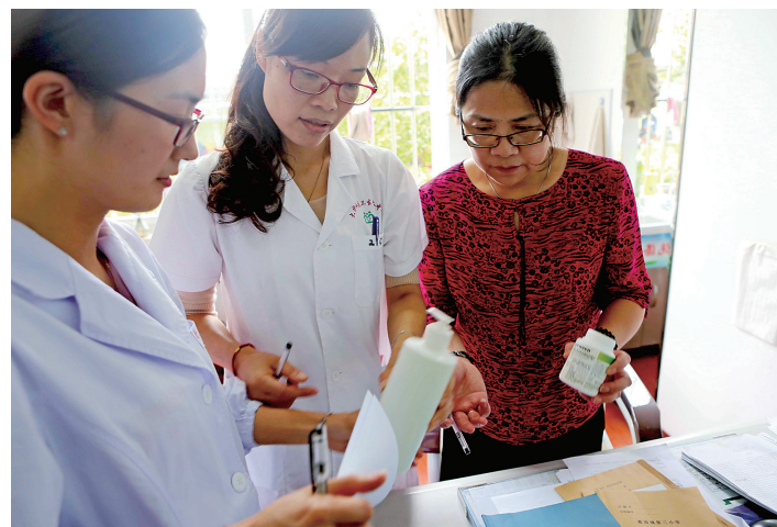
⑦医生向学校发放应急眼病药物。