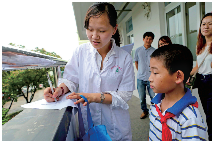
⑤医生前往发生“疫情”的班级询问登记。