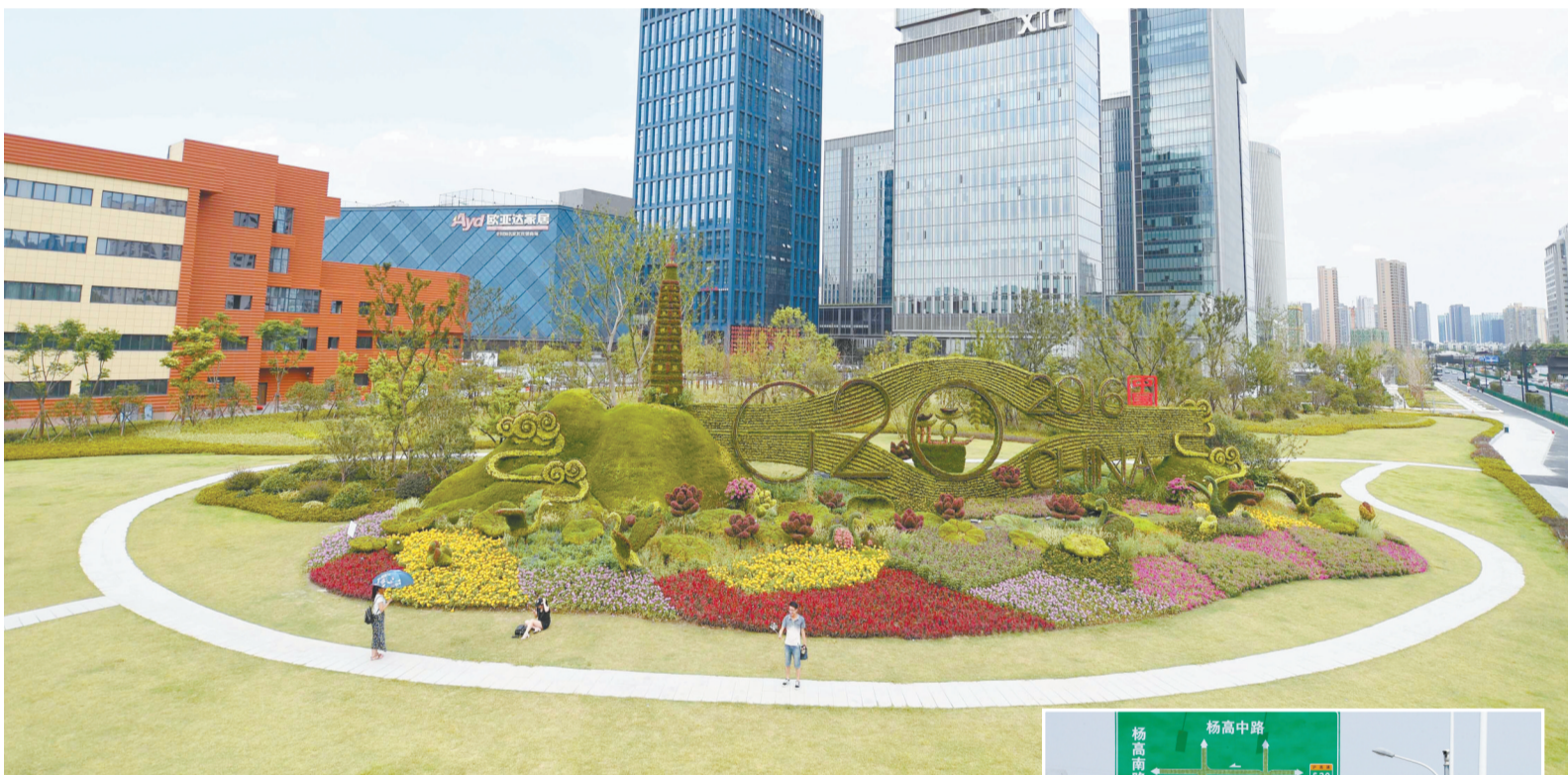
杭州市区的一处G20主题花坛。