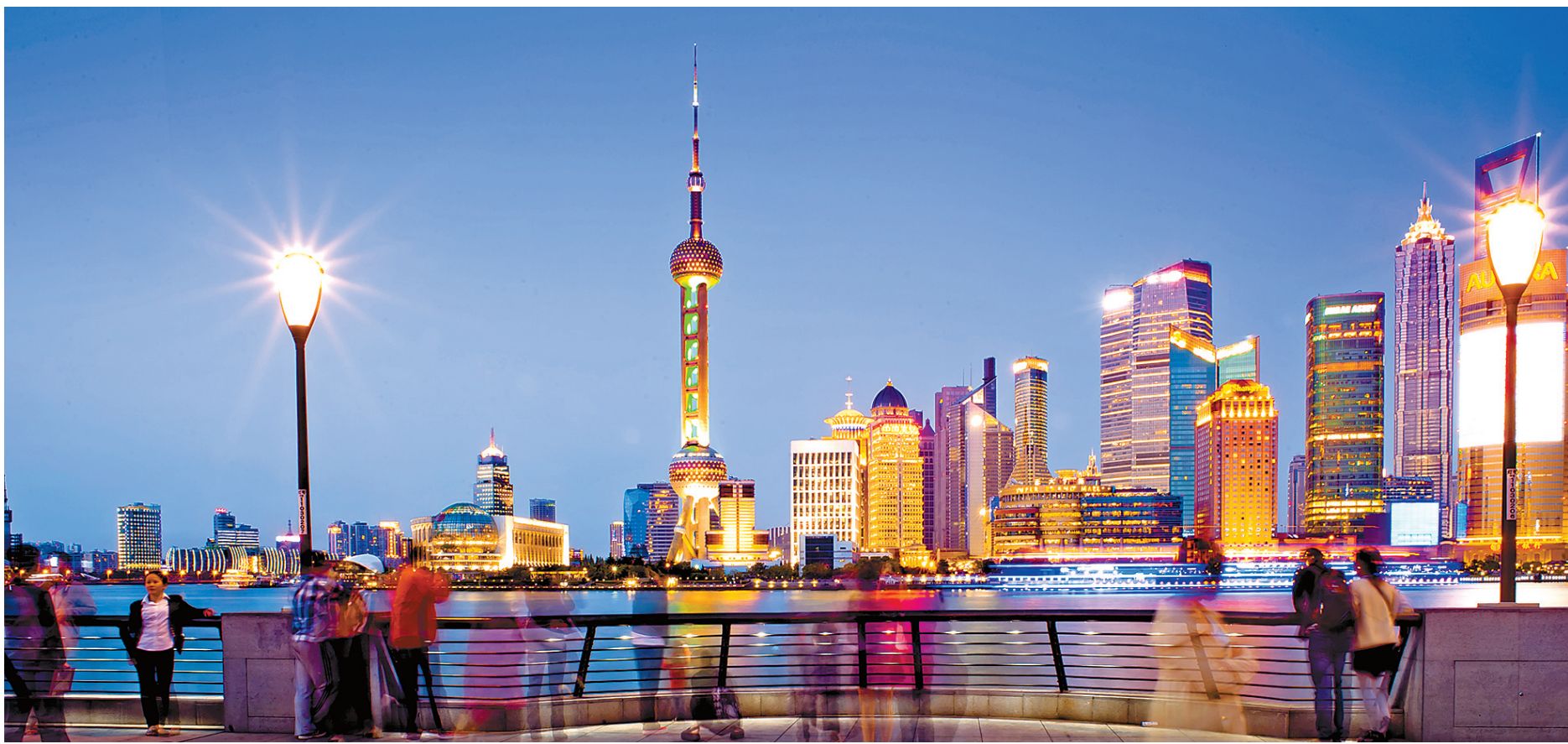
28年来,浦东书写了一个又一个第一。图为华灯初上的陆家嘴。

国内最大的网络文学企业阅文集团,去年在香港上市。在上个月刚刚公布的2017年度财报里,全年收入40.95亿元,同比增长60.2%;全年净利润5.561亿元人民币,同比增长141.6%。“对阅文而言,上市就两个目的,一个是对过去十几年工作的总结,证明这十几年没有浪费,我们做好了这件事情;第二个是我们有了新目标,所以需要更多钱来完成。”阅文集团副总裁、起