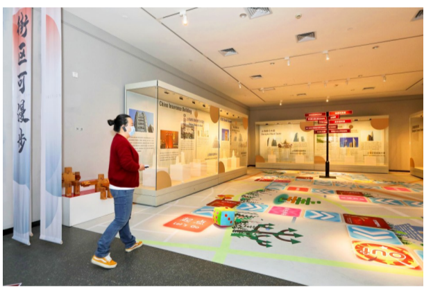
棋盘式互动布置,让艺术展内容展现更加多元。

展览最后板块定位于洞见未来,继往开来。这里有一条条B站弹幕,致敬当下;还有一幅幅儿童绘画,献礼未来。在这里,观众可聆听白发长者青春激扬的《少年》之歌,也可重温党徽下的庄严宣誓。浦东2035年远景目标纲要已经公布,展览邀请生活在2021年的你,给2035年的自己写一封信:“未来,浦东和你一定会变得更加美好!”