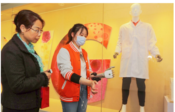
志愿者演示高科技联动项目运用场景。