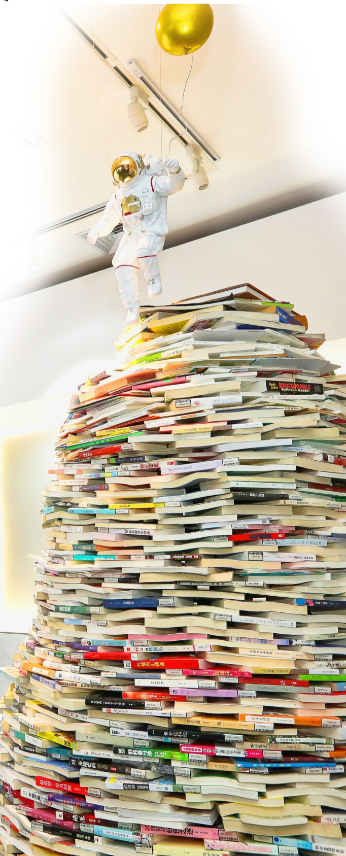
由1210公斤书籍构造出的“建筑可阅读”遐想空间成展区亮点。