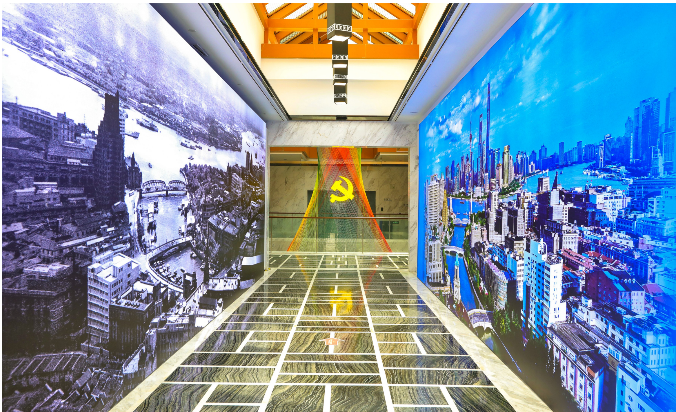
新旧照片对比,让观众直观感受到浦东日新月异的变化。